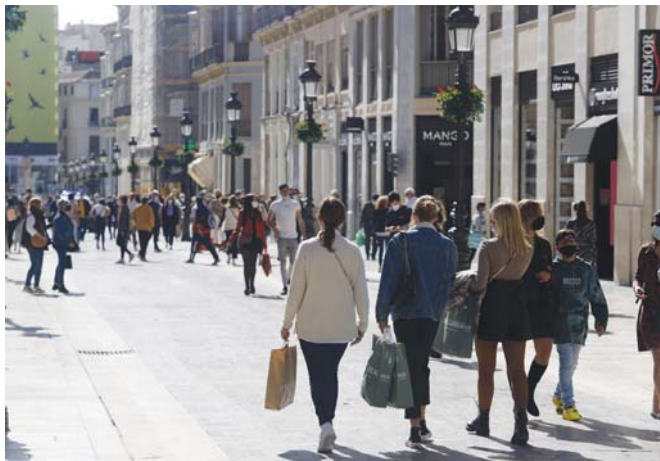
El comercio y la hostelería amplían horarios y aforos según las nuevas medidas.

El comité territorial dejó sin efecto las resoluciones vigentes y valoró todos los municipios en función de la tasa de incidencia actualizada a fecha de este jueves. La vigencia de las medidas es de siete días, después de su publicación en Boletín Oficial de la Junta