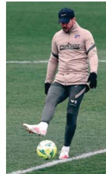
Simeone en el entreno de ayer.

Por las plazas de Liga Europa, Real Sociedad (42 puntos), Betis (39) y Villarreal (37)