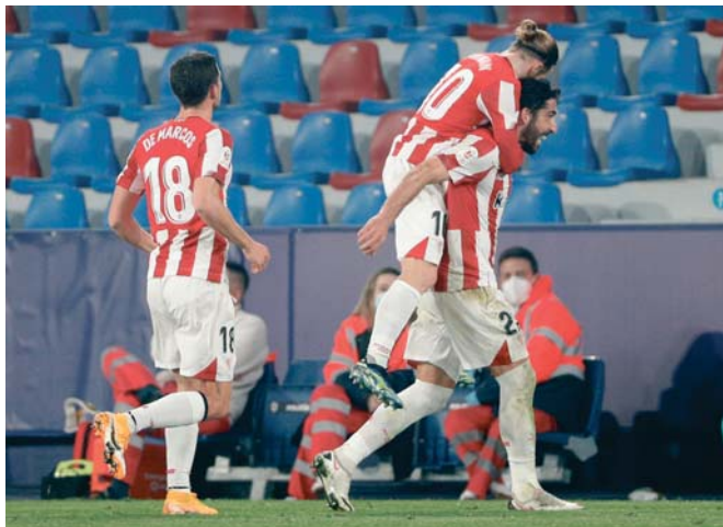
Los jugadores del Athletic disputarán dos finales de Copa del Rey en el mes de abril.

Incidencias: Partido de vuelta de las semifinales de la Copa del Rey disputado sin público en el estadio Ciutat de València.