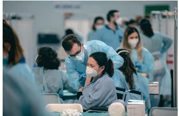
Las vacunaciones continúan mientras los contagios se han ralentizado en la provincia.

En cuanto a los hospitales, si que se ha registrado un incremento de los pacientes hospi-