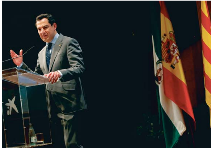
El presidente de la Junta de Andalucía, Juanma Moreno, durante un acto en Barcelona.

Por ahora, la pandemia parece estar dando una tregua en Andalucía, al disminuir su incidencia en los últimos días. De hecho, Andalucía registrará desde este viernes un total de 404 municipios de todas las provincias menos Almería y Granada, entre ellas cinco capitales: Córdoba, Huelva, Jaén, Málaga y Sevilla en nivel de alerta 2 como consecuencia de la situación crítica epidemiológica