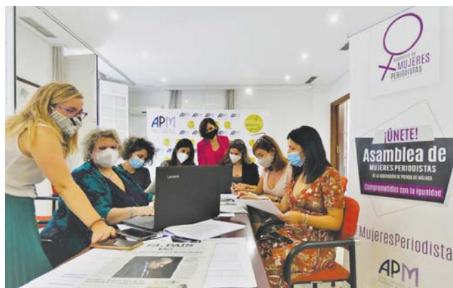
Actividad de la Asamblea de Mujeres Periodistas de Málaga. AMP