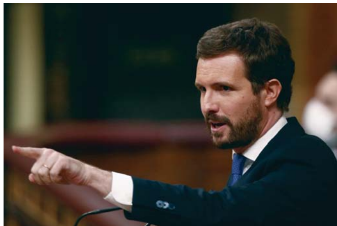
Pablo Casado, presidente del Partido Popular nacional.