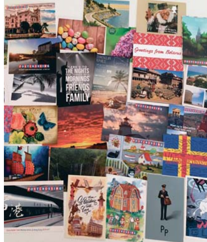
Más de 1.100 postales son recibidas cada hora.

Elegir la postal, escribirla y llevarla al buzón se ha convertido en un ritual, “la sensación de que alguien gastó tiempo de su día