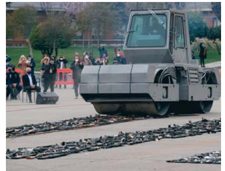
Un momento del acto de destrucción de las armas.

trucción de armas de ETA, y criticaron que coincidía con el traspaso de las competencias de prisiones y la política de acercamiento de presos al País Vasco. El presidente del PP, Pablo Casado, subrayó “al Gobierno le sobran los actos de propaganda, los pactos con Bildu y los acercamientos de presos etarras” y recordó que “la sociedad española derrotó a ETA con la Ley, los Cuerpos de Seguridad y la cooperación internacional”.