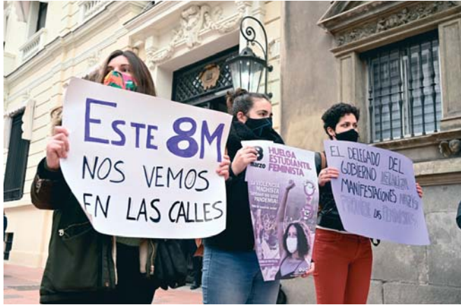
Sindicatos de estudiantes adelantaron que saldrán a la calle pese a la prohibición.