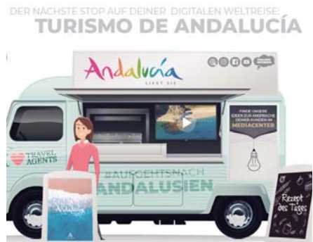
Imagen de la campaña promocional dirigida al mercado alemán.

Cuenta con más de 2.500 oficinas asociadas en Alemania y Polonia y coopera con más de 60 operadores y proveedores turísticos.