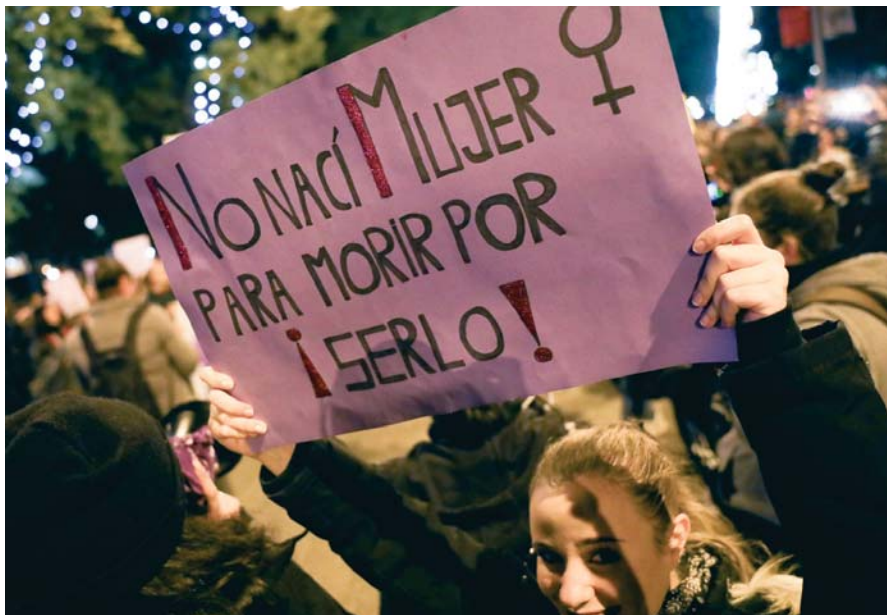
Manifestación con motivo del Día Internacional para la Eliminación de la Violencia contra las Mujeres.

Ya en materia, el servicio telefónico de información y asesoramiento jurídico en materia de violencia de género 016, que también cuenta con consultas online en el 016-online@igualdad.gob.es, recibió un total de 3.237 llamadas en 2020, lo que supone un 23,97% más que en 2019. Es destacable que los meses con un mayor volumen de llamadas fueron abril (360), mayo (376) y junio (348), coincidiendo con el confinamiento.