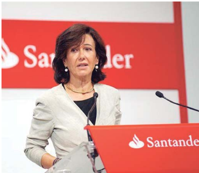
La presidenta del Banco Santander, Ana Botín.

La plataforma acusa al Banco Santander y a los fondos buitres de aprovecharse de