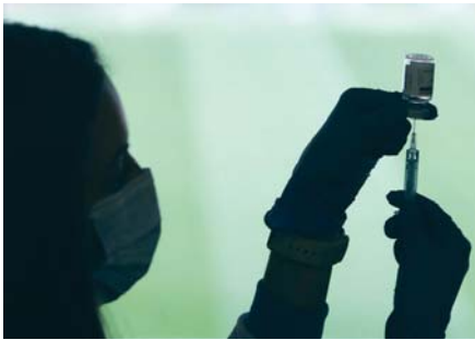
Vacuna contra el Covid-19.

Además, la cifra de personas hospitalizadas por coronavirus vuelve a descender y se sitúa por debajo de la veintena tras contabilizar tres ingresos menos. En total, en estos momentos sólo hay 18 per-