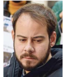
Pablo Hasel.

El informe del educador social de la prisión, al que ha tenido acceso, refleja que Hasel ha rechazado el PIT, pero también deja constancia que desde su ingreso no se le ha abierto ningún expediente