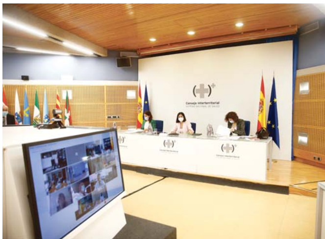
Carolina Darias (c) preside el Consejo Interterritorial del Sistema Nacional de Salud.

En la rueda de prensa, Darias también se refirió a hipotética segunda dosis de Janssen y la ampliación de terceras dosis a otros colectivos,