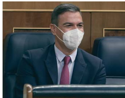
Pedro Sánchez, con mascarilla, en el Congreso de los Diputados.

Ha recordado que en el Estatuto de Autonomía se plantean instrumentos de cooperación como este "que, sin duda, es conveniente utilizar".