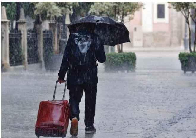
Una persona camina bajo una intensa lluvia en la Comunidad Valenciana.

MADRID. EFE | El otoño se ha estrenado en España con las intensas lluvias provocadas por la DANA que en las últimas horas ha provocado inundaciones e incidentes en Baleares y varios puntos del Levante y ahora se desplaza hacia el oeste peninsular. La AEMET prevé para hoy cielo nuboso en los tercios central y meridional de la Península y en Baleares, con chubascos y tormentas, más intensos en la mitad norte del área mediterránea, Baleares y suroeste peninsular.