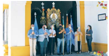
Simpecado de Emigrantes. VH

La hermandad rociera pide la "máxima colaboración" para que el recorrido transcurra con normalidad