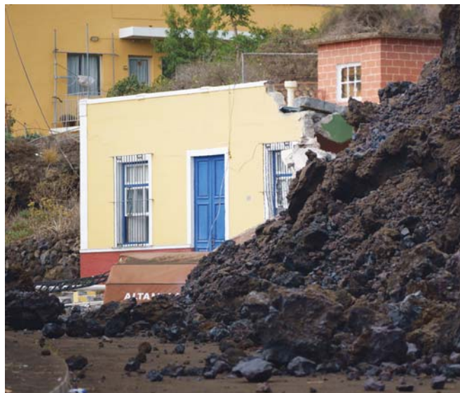
La lava irrumpe en Todoque, en el municipio de Los Llanos, derribando todo a su paso.

La lava, que ha ido ganando en viscosidad, de ahí que discorra más lenta, alcanza espesores entre 8 y 15 metros en su lengua más activa y la sismicidad continúa en bajos niveles. La estimación de la tasa de emisión de dióxido de azufre (SO 2 ) a la atmósfera por este proceso eruptivo oscila entre 6.140 y 11.500 toneladas diarias. Estos valores, aunque correctamente medidos, están infraestimados por la gran dimensión del penacho de dió-