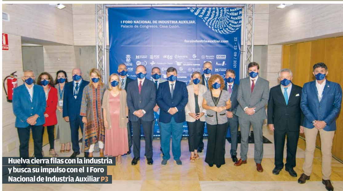
Huelva cierra filas con la industria y busca su impulso con el I Foro Nacional de Industria Auxiliar P3

Objeción de conciencia Irene Montero urge a blindar el derecho a abortar P11