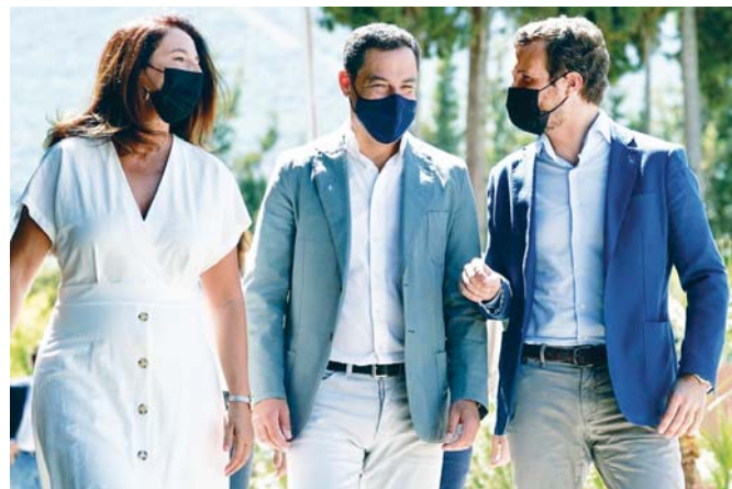
Juanma Moreno, en el centro, acompañado por el líder del PP nacional, Pablo Casado.

Moreno, durante una entrevista en la Cadena Cope, ha asegurado que Andalucía va a "ejercer un liderazgo" en las cuestiones importantes del país y va a actuar "como dique de contención" ante las "derivadas independentistas" del presidente del Gobierno, Pedro Sánchez, con sus negociaciones bilaterales.