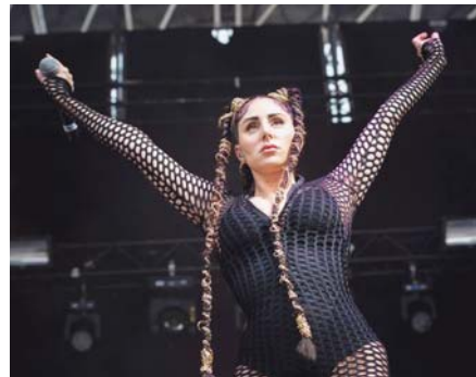
Mala Rodríguez durante un concierto antes de la pandemia.

El Bull Music Festival, que nació ecléctico y que mantiene en su vuelta tras la pandemia esa esencia, está englobado en el ciclo Granada Vibra , que tendrá lugar a lo largo del próximo mes en esta capital andaluza y que supone el retorno de este tipo de formatos culturales.