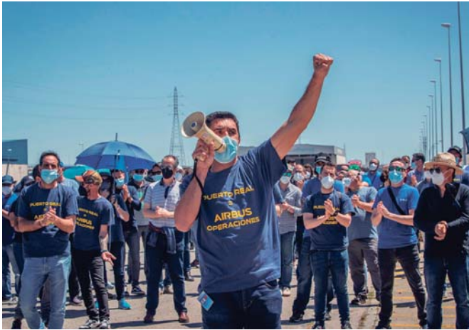
Trabajadores de Airbus Puerto Real se concentran contra el cierre de su planta.

La segunda, se centra en el desarrollo de un plan industrial para España, "que tenga su eje central en el futuro de la Bahía de Cádiz y el resto de los centros en España, con competencias, cargas de trabajo". El objetivo es que la multinacional aeronáutica mantenga sus inversiones, capacidades y, por tanto, su aportación al PIB industrial del país.