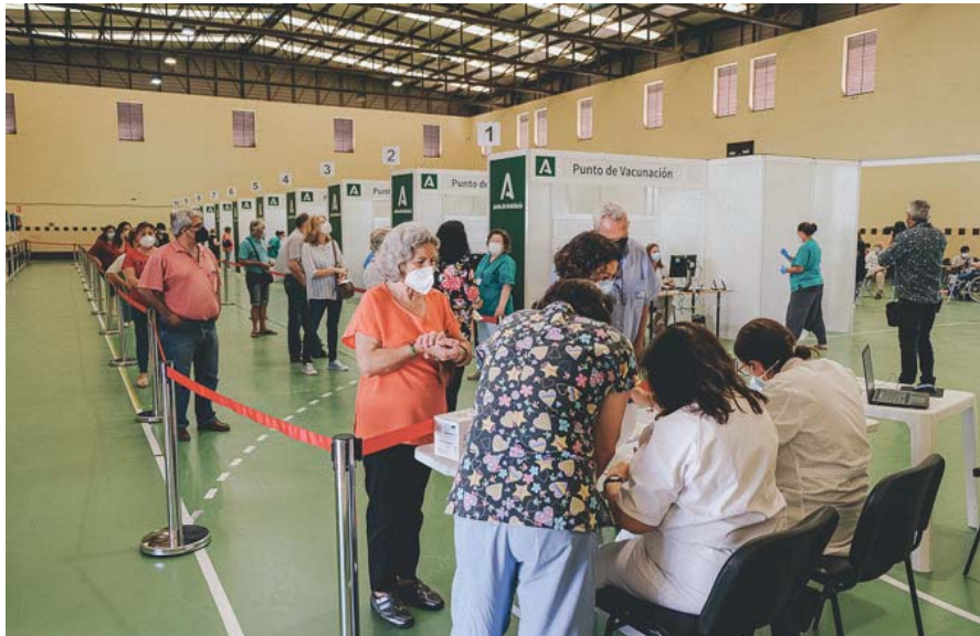
La Consejería de Salud citó ayer en horario de mañana y de tarde a decenas de jerezanos para vacunarse en este nuevo punto. CRISTO GARCÍA

La entrada al espacio habilitado para vacunación a pie, contará con un circuito establecido y debidamente señalizado, donde las entradas y salidas de las personas estarán diferenciadas, existiendo una zona de espera posterior que sirva como punto de ob-