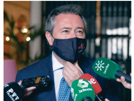
Juan Espadas, alcalde de Sevilla y precandidato de las primarias.

Por último, el precandidato a las primarias del PSOE-A Luis Ángel Hierro ha indicado que su candidatura es "la única con capacidad para atraer a la izquierda" tanto a los votantes como al Gobierno andaluz.