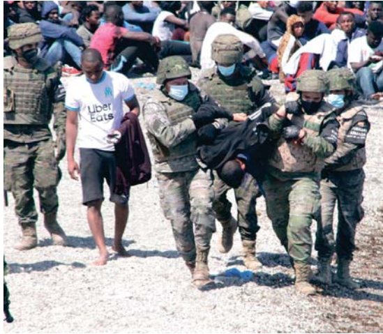
Varios soldados trasladan a un inmigrante en la playa de El Tarajal de Ceuta.

Este es el punto en el que desde el lunes han entrado en Ceuta cerca de 8.000 personas a nado o bordeando a pie los dos espigones fronterizos con Marruecos. Unos 4.000