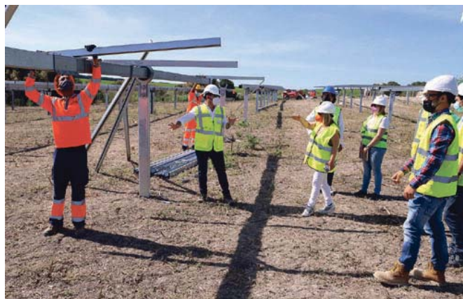
La alcaldesa y el delegado de Urbanismo visitaron ayer las obras del nuevo parque.

La alcaldesa pudo conocer de primera mano las distintas fases en las que se encuentran estas obras, que dieron comienzo en octubre, y que cuentan con una media de entre 280 y 300 trabajadores diarios. "Desde el Gobierno y siguiendo las directrices de la Agenda 2030, hemos hecho una apuesta importante por facilitar la implantación de empresas del sector de las energías renovables en el término municipal de Jerez, que se está convirtiendo en un importante polo de atracción de