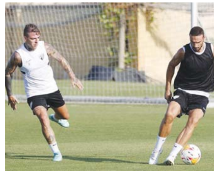
Trabajo con balón en un entreno durante esta semana.