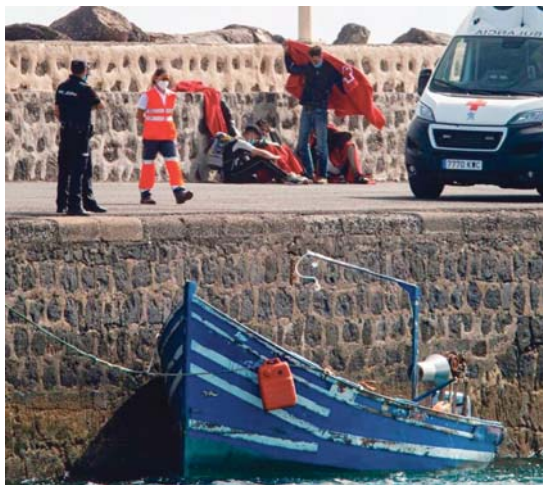
Cruz Roja atiende a unos migrantes al sur de Mallorca este domingo.

El efecto sobre las llegadas depende del control migratorio en los distintos puntos de las fronteras. "Hay un claro efecto de vasos comunicantes: más control en el Estrecho, más sal-