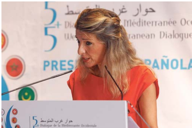
La Vicepresidenta segunda y ministra de Trabajo y Economía Social, Yolanda Díaz.

La subida, que podría aprobarse en el próximo Consejo de Ministros, es resultado de la mesa específica de diálogo social que empezó el 1 de septiembre y de la que se han desglosado las patronales CEOE y Cepyme, contrarias a adoptar una nueva subida del salario