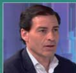
FRANCISCO MORÓN Delegado Europa Press