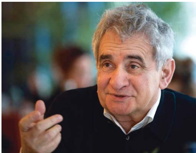
El escritor y poeta vasco premiado por la Federación de Gremios de Editores de España.

En el mismo acto se entregarán, además, el premio al Fomento de la lectura en medios de comunicación a Carles Francino; el premio a la mejor adaptación audiovisual de una obra literaria a la serie Patria producida por