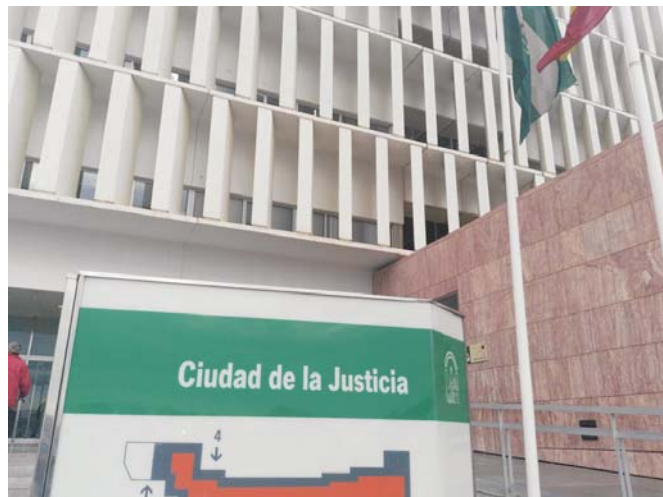
Imagen de archivo de la Ciudad de la Justicia de Málaga.

Por esto, se indica en el documento de la Fiscalía Superior andaluza que "no debe extrañarnos, por tanto, que esta situación siga siendo fuente de