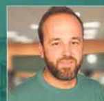
JUANJO CUÉLLAR Periodista La Sexta