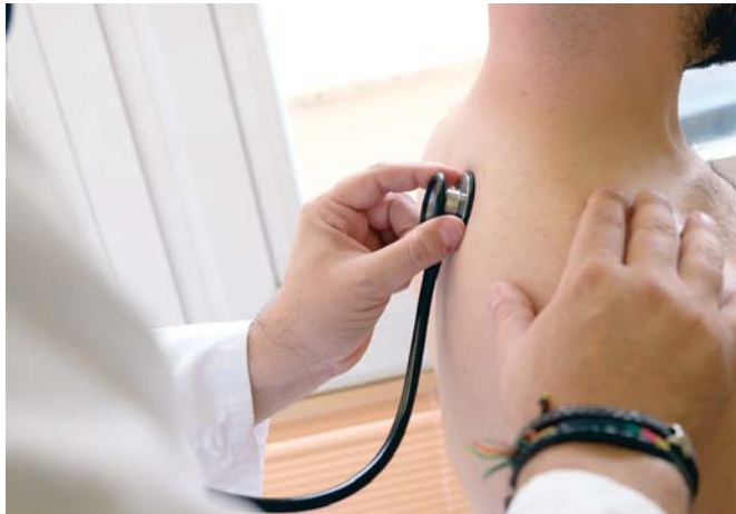
Un médico atiende a un paciente en una sala de un hospital andaluz en tiempos prepanidemia.

Este modelo actualmente consta de un "doble circuito", con la diferenciación de zonas para pacientes Covid y otras para aquellos con cualquier otra patología. "Este modelo dificulta la atención presencial y en toda España es así", ha indicado Moreno.