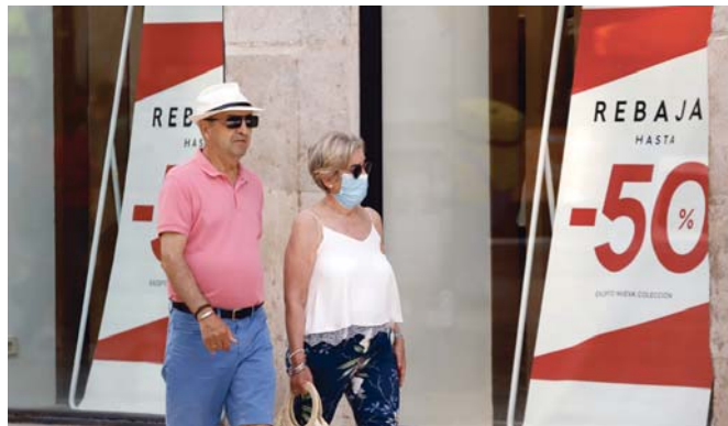
Contraste en el uso o no de la mascarilla en espacios exteriores (archivo).

Respecto al proceso de vacunación, sigue su curso en el conjunto de la provincia de Málaga donde se han ampliado sedes y horarios para la administración de la primera dosis contra la COVID para cualquier ciudadano de Andalucía sin cita pre-