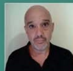
RAÚL LIMÓN Periodista El País