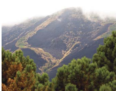
El verde y el gris se combinan estos días en Sierra Bermeja.