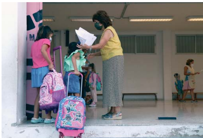
Imagen de archivo del primer día del curso escolar en Málaga.

En cuanto a lo que esperan para este curso, que comenzó el día 10 para los alumnos y las alumnas de Primaria y el 15 para los de Secundaria, Bachillerato y FP, quieren que “ningún niño se vea perjudicado por el covid, porque el riesgo es el mismo, ya que los menores de 12 años no están vacunados. Desde la Junta no