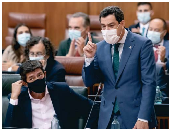
El presidente de la Junta de Andalucía, Juanma Moreno, garantiza que quiere aprobar las cuentas.

sa bilateral, con el fin de “hablar de los problemas de los andaluces”. Ha lamentado que el Ejecutivo de Pedro Sánchez “no es capaz de sentarse con las comunidades