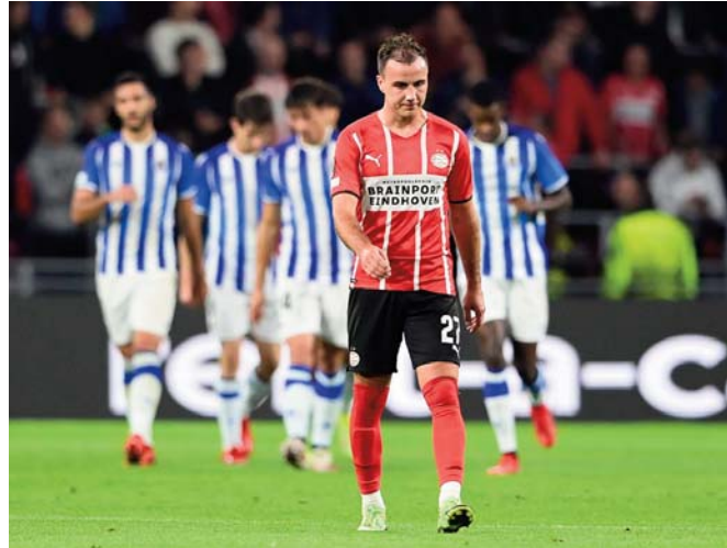
Mario Goetze lamenta uno de los dos goles marcados por la Real Sociedad en el Phillips Stadium.

SEVILLA | El Betis inició ayer su camino en la fase de grupos de la Liga de Europa con una sufrida victoria ante el Celtic, en un partido en el que tuvo que remontar un 0-2 que los visitantes lograron en la primera media hora y aguantar los últimos minutos tras recortar los escoceses con un tercer tanto que les fue insuficiente.