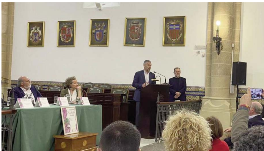
Presentación del I Congreso Tintilla de Rota. VIVAROTA.

En ellas han resaltado el valor de esta jornada y de la