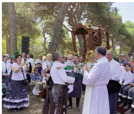
Foto de la Romería VIVAROTA

Una nueva edición de la Romería volverá a inundar el pinar roteño de verbena y buen ambiente como suelen acostumbrarnos para mostrar su devoción.