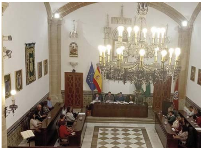
Imagen de un pleno ordinario.

Tras el pleno se inauguró una exposición con los trabajos presentados a los certámenes de pintura y narrativa sobre los Derechos del Niño, organizada por la Delegación de Servicios Sociales.