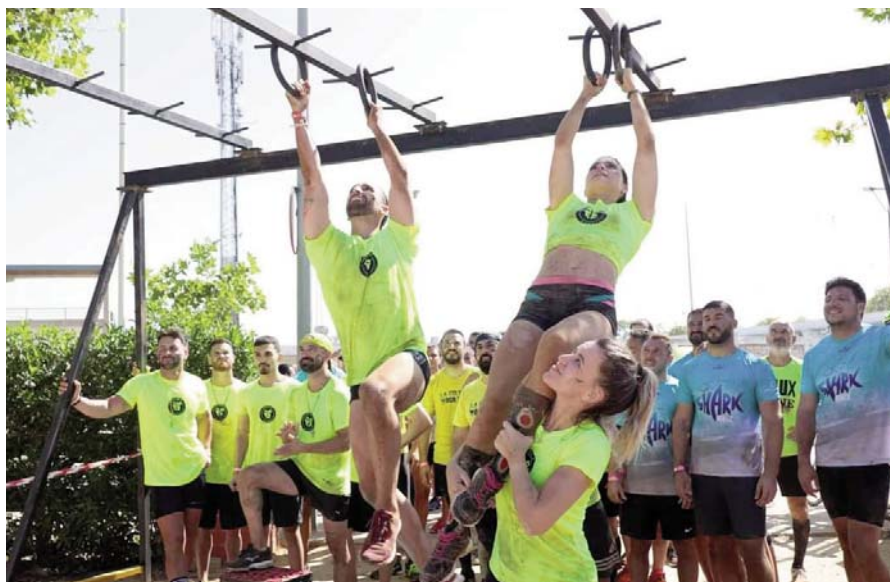
Un grupo de participantes trata de superar una de las pruebas de la 'Sharkrace' durante la edición disputada el año pasado

CARRERA DE OBSTÁCULOS Celebrará su segunda edición tras la gran acogida del año pasado