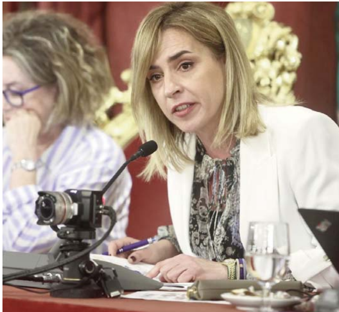
Almudena Martínez, presidenta de la Diputación.

También, según ha indicado Diputación, figura una ayuda de 15.000 euros para sufragar los gastos de pruebas de exhumación, ADN y traslado de los restos mortales de los marineros víctimas del naufragio del pesquero