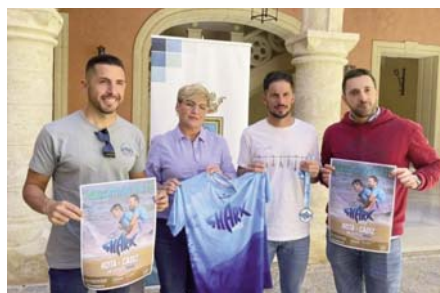
Presentación de la segunda edición de la 'Sharkrace' VIVA ROTA