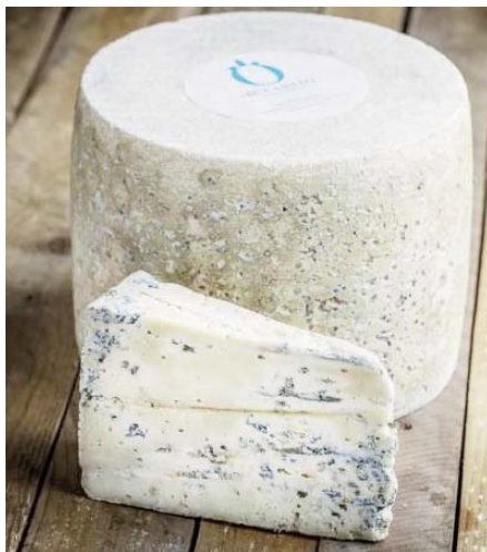
Queso azul 'El Bucarito'. 'EL BUCARITO'

Respecto al premio de 'Quesos azules' cabe destacar que el queso artesanal roteño es completamente singular. Tra-